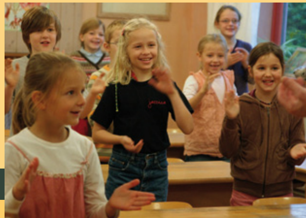
Lernen in Bewegung

Es gilt das Förderprinzip. Die individuelle Leistungs-, Sozial- und Persönlichkeitsentwicklung der Kinder und Jugendlichen wird beschrieben, deshalb gibt es kein Sitzen bleiben. Die intellektuellen Fähigkeiten werden in gleicher Weise entwickelt wie kreative, künstlerische, praktische und soziale Fähigkeiten.