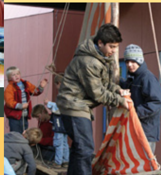
Pausenspiel im Boot