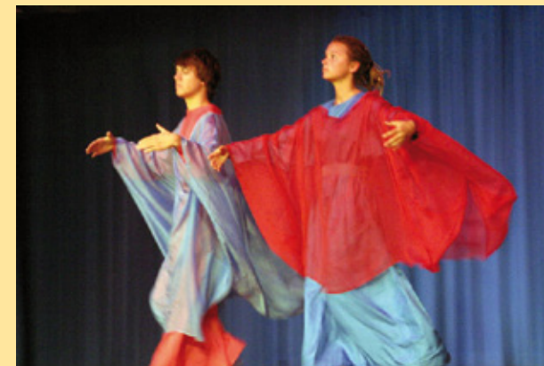
Eurythmie ist »sichtbare Sprache« und »sichtbare Musik«, eine Bewegungskunst, die die Selbstwahrnehmung schult und die Wachsamkeit und Rücksichtnahme im Miteinander fördert.

Neben den so genannten »großen Klassen« gibt es die Förderklassen mit etwa 12 Schülern, die eine intensivere Begleitung ihrer Lernentwicklung benötigen.