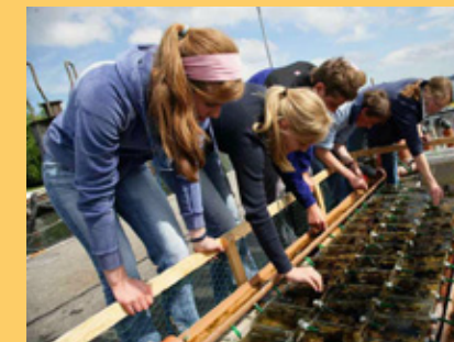
Meereskunde AG in Zusammenarbeit mit dem Institut für Meereskunde IFM Geomar.

(in Abhängigkeit von der jeweiligen Nachfrage) Hausaufgabenbetreuung Computer kreativ Musik: Bläserorchester, Mittelstufenorchester Oberstufenchor, Oberstufenorchester Sport: Segeln, Volleyball, Handball, Basketball AG Klettern, Zirkus, Bogenschiessen Sprachen: Russisch, Spanisch AG Meereskunde AG Theater AG Schach AG