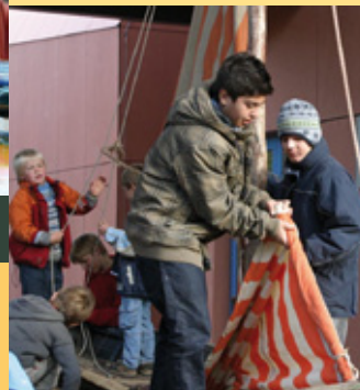
Pausenspiel im Boot