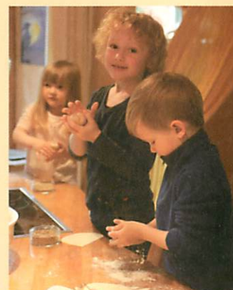
Brötchen fürs Frühstück formen