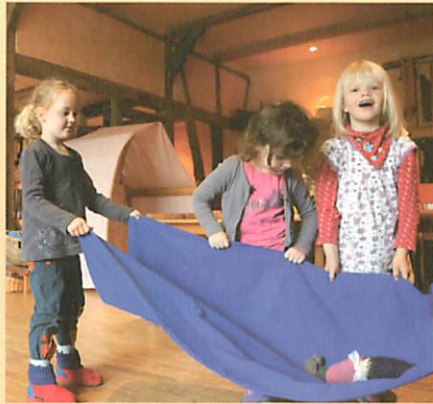
Freies Spiel mit Puppen