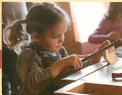
Werken mit Holz