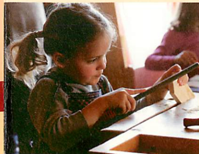
Werken mit Holz