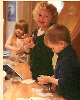
Brötchen fürs Frühstück formen