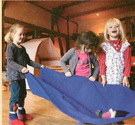
Freies Spiel mit Puppen