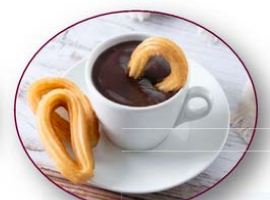
Churros mit Schokolade