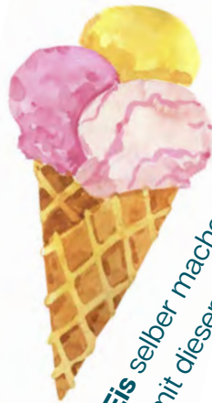
Eis selber machen zB mit diesem Rezept