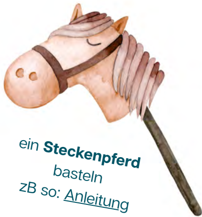
ein Steckenpferd basteln zB so: Anleitung