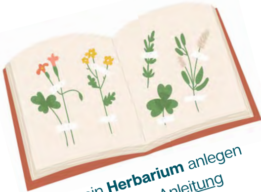
ein Herbarium anlegen zB so: Anleitung