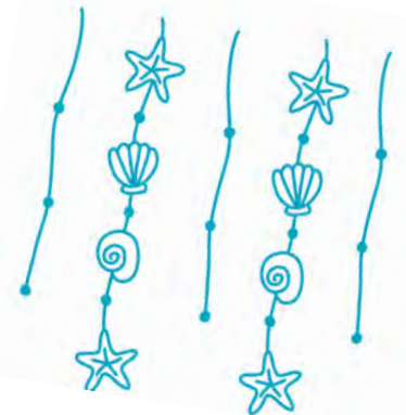
ein Windspiel aus Naturmaterialien bauen zB so: Anleitung