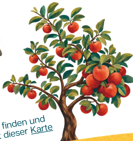
freies Obst finden und sammeln mit dieser Karte